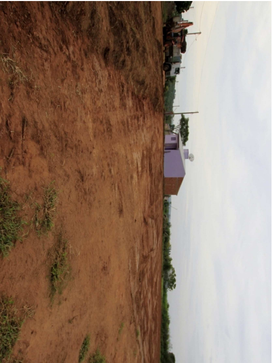
FOTO DO TERRENO 1