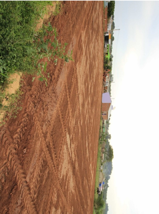
FOTO DO TERRENO 3