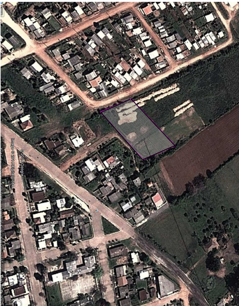
TERRENO DESTINADO À CONSTRUÇÃO DE CRECHE MUNICIPAL