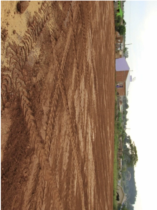
FOTO DO TERRENO 2