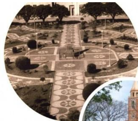
Praça das Mercês na década de 60