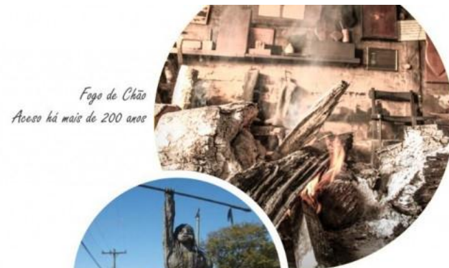
Fogo de Chão Acesso há mais de 200 anos