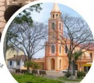
Igreja Nossa Senhora das Mercês