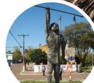
Estátua do Índio Sepé Tianguá